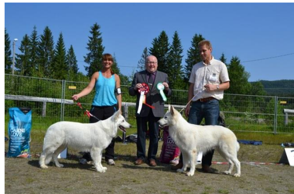
BIR og BIM rase-spesial 2013

Det ble knyttet nye bekjensker og ble mang en god samtale rundt bordet langt ut i kveldstimen.